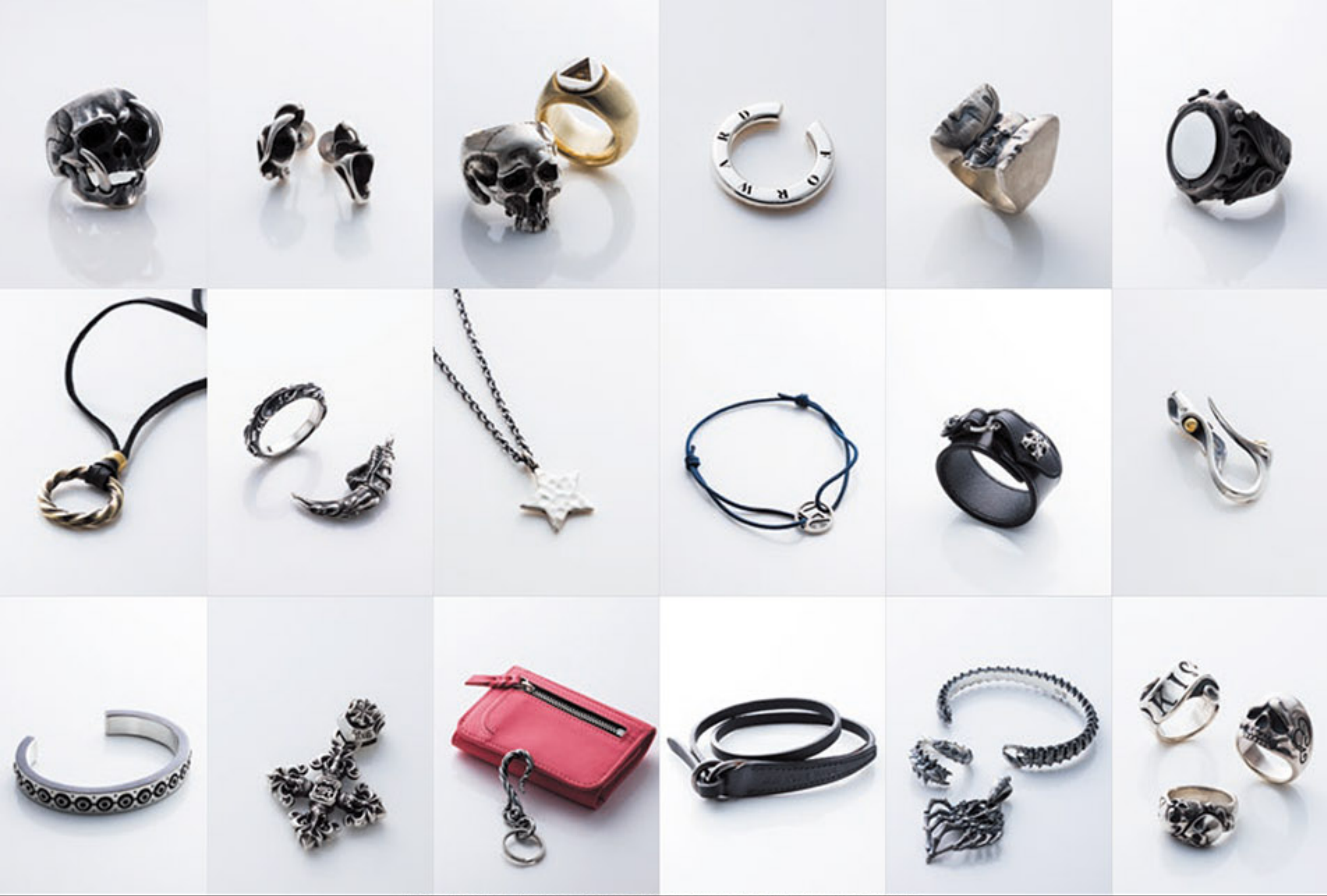
Styling = Kaname Terakubo Text = Yasuyuki Kitamura